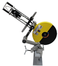
91-1020 SCIE, INVERSEUR, HYDRAULIQUE POUR RAIL 16"