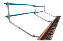
91-7030 BARRIÈRE DE SÉCURITÉ TÉLESCOPIQUE

Vortok propose des solutions uniques pour l'entretien des voies, la signalisation et la déstension des rails.