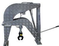
91-7015 SYSTÈME DE SURVEILLANCE DES VERSETS