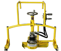
91-1110 MEULEUSE HYDRAULIQUE DE CUR DE CROISEMENT PROFILE

Matweld, Inc. est une société internationale proposant des produits ferroviaires de haute qualité pour l'industrie ferroviaire, spécialisée dans les outils et équipements hydrauliques à main.