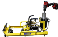
91-1037 CISAILLE DE SOUDURE ALIMENTÉE PAR BATTERIE