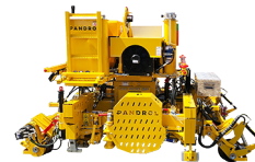
91-5130 CLIPPEUSE CD400 SP