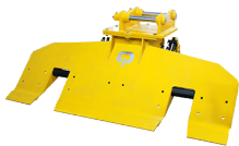
91-5100 CHANGEUR DE TRAVERSE, SB60

Matweld, Inc. est une société internationale proposant des produits ferroviaires de haute qualité pour l'industrie ferroviaire, spécialisée dans les outils et équipements hydrauliques à main.