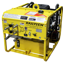
91-1000 GROUPE MOTEUR