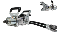
91-1040 CLÉ À CHOC HYDRAULIQUE