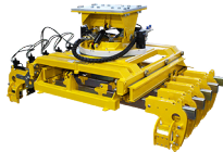
91-5115 GRAPPIN POUR TRAVERSES, SL550